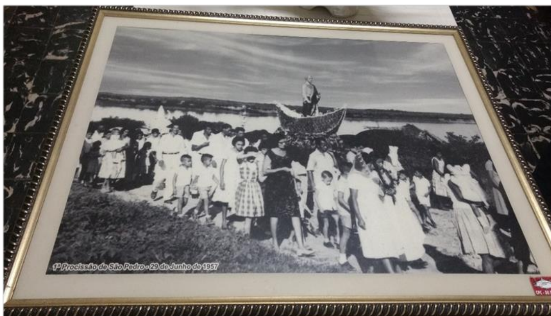
Figura 1: Procissão a São Pedro.

Desde a sua primeira edição em 1957 (FIGURA 1), a procissão ao Padroeiro no município de Boa Vista foi sendo modificada por novos percursos e programações, como observado em diferentes fontes, a jornalista, entrevista e em conversa com diferentes grupos que participaram da procissão. A figura a seguir é uma fotografia da primeira procissão, que foi emoldurada e está na igreja de São Pedro.