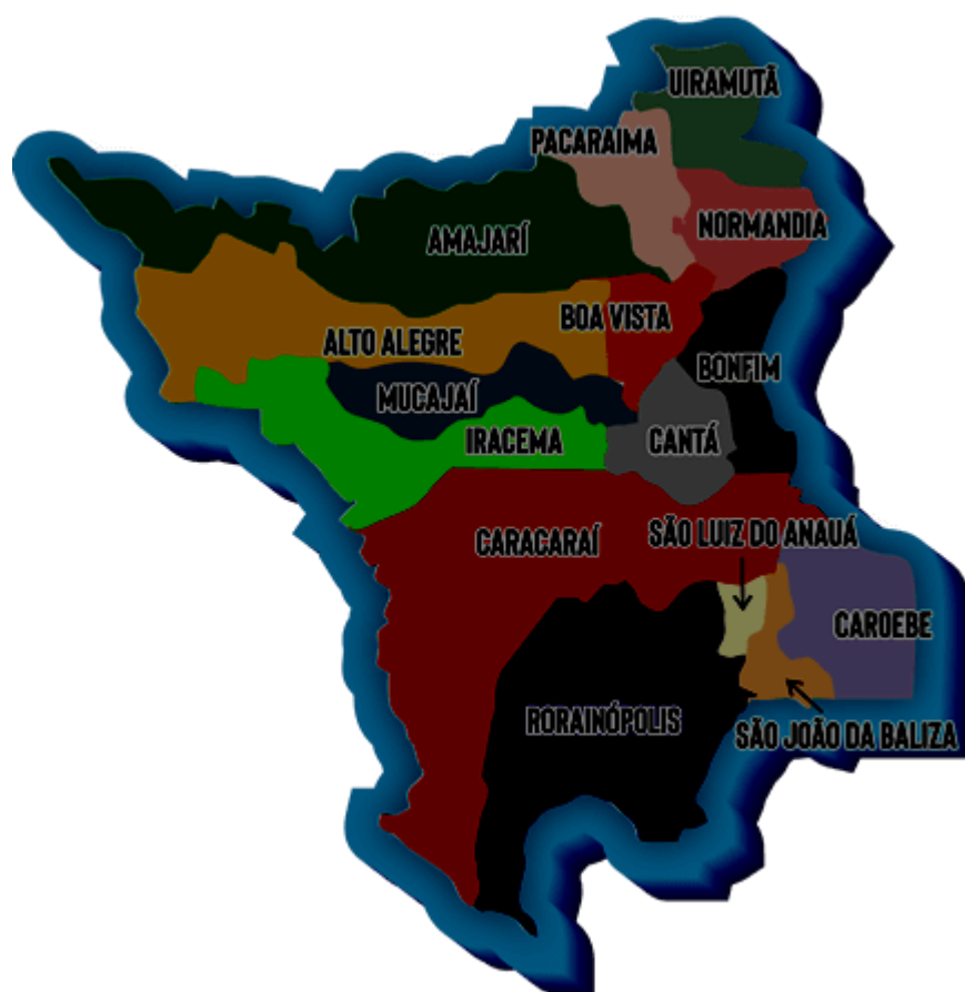
Figura 2 – Localização do município de Caroebe em Roraima